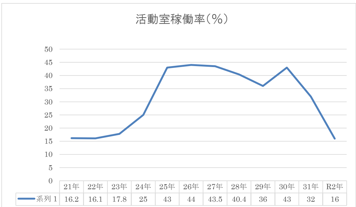
図一 4：活動室稼働率推移