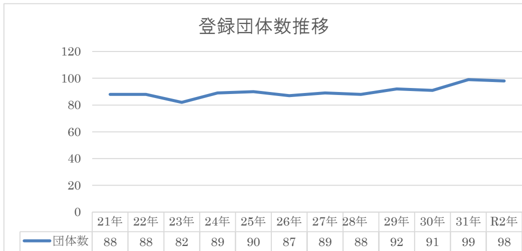
図一 3：登録団体数推移